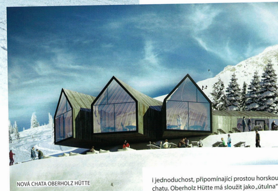
NOVÁ CHATA OBERHOLZ HÜTTE

Ve vybraných březnových dnech můžete mít sjezdovku od 7 hodin od rána sami pro sebe a v 9 hodin pak usednout k bohaté snídani v horské chatě. Podmínkou je rezervace nejpozději den předem.